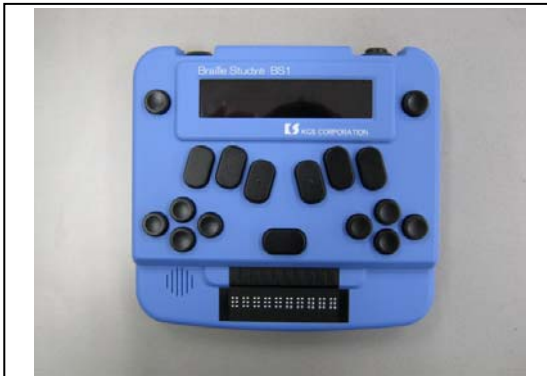
ブレイルスタディ BS1(本体)