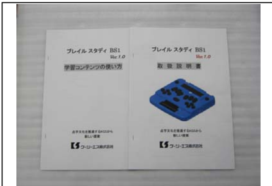
取扱説明書(墨字版)