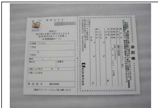
保証書・ユーザー登録はがき