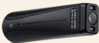
視覚支援デバイス

メモ機能が活躍 弊社広報チームのTIKTOK動画のアイデアを出し、 撮影を行って出演してみよう