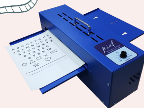
立体コピー作成機